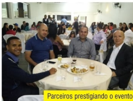
Parceiros prestigiando o evento.

Ganhadores dos prêmios sorteados na confraternização: