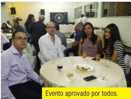
Evento aprovado por todos.