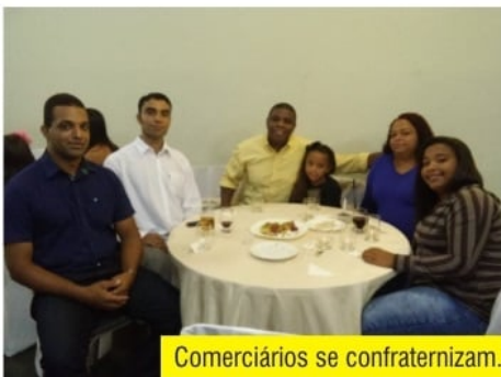
Comerciantes se confraternizam.